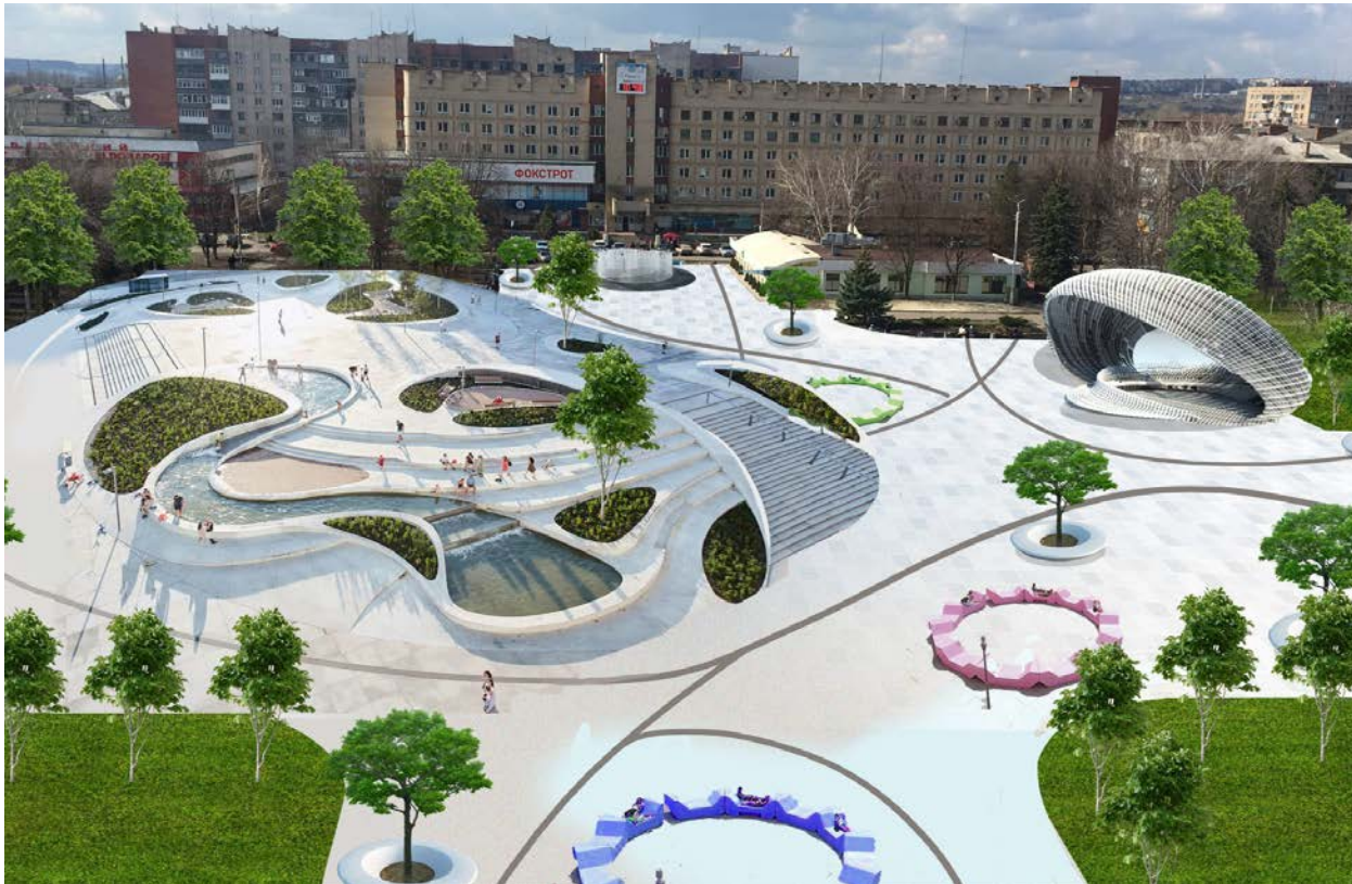
1-й варіант перетворення Соборної Площі