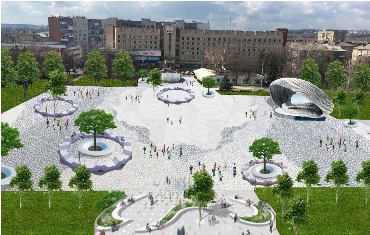
2-й варіант перетворення Соборної Площі