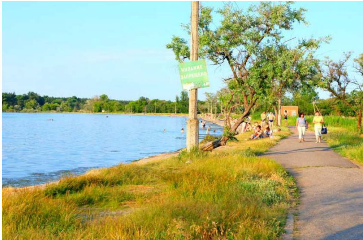
Берегова лінія озера Ропне