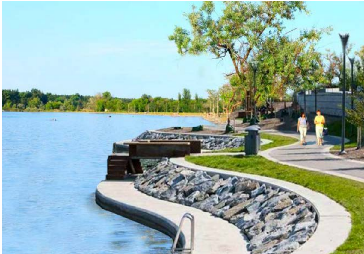
Берегова лінія озера Ропне