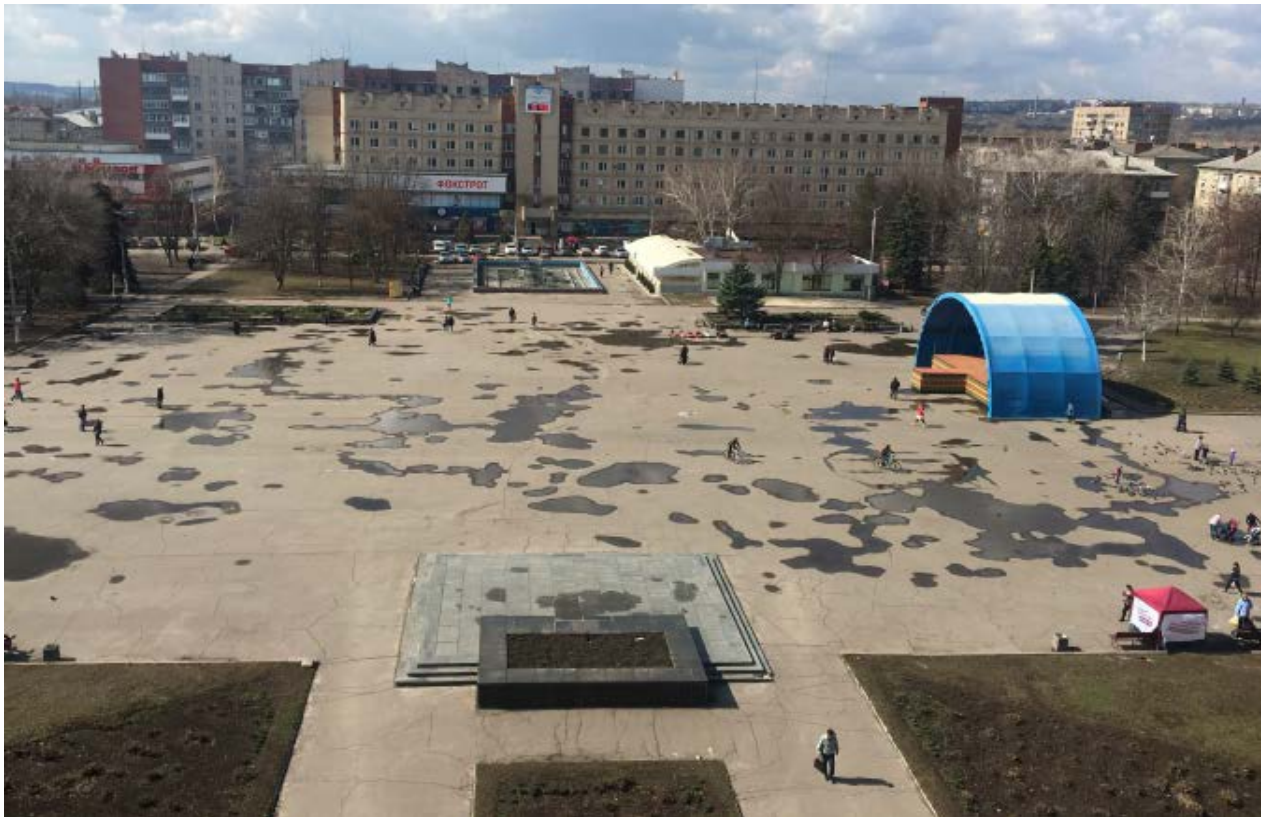
Соборна Площа сьогодні