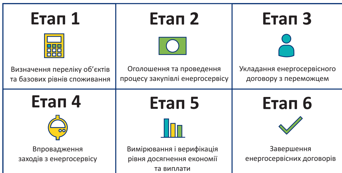
Рис. 2. Етапи реалізації енергосервісного договору

Впровадження енергосервісних договорів відбувається у кілька основних етапів (див. рис. 2).