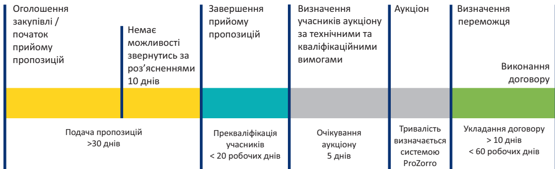
Рис. 3. Строки та етапи процесу закупівель