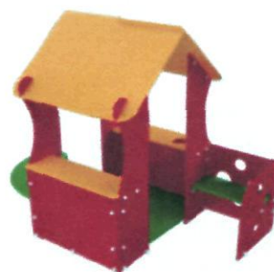
P-46 11000 грн.