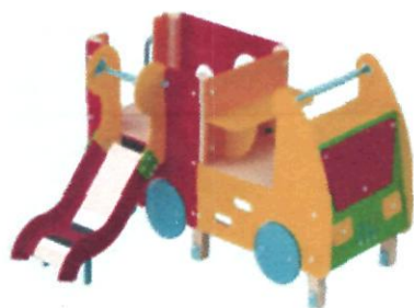
A-51 24000 грн