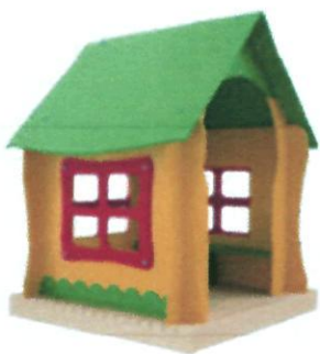
P-55 14300 грн.